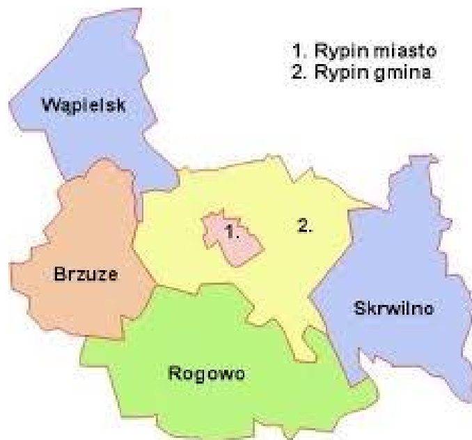
Rysunek 2. Lokalizacja Gminy Skrwilno w powiecie rypińskim

W skład Gminy wchodzi dziewięć sołectw (Budziska, Czarnia Duża, Czarnia Mała, Kotowy, Mościska, Okalewo, Otocznia, Przywitowo, Rak, Ruda, Skudzawy, Skrwilno, Szczawno, Szucie, Szustek, Urszulewo, Wólka, Zambrzyca, Zofiewo).