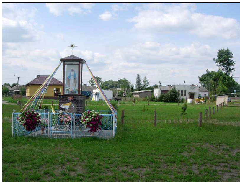
Ryc. 5. Kapliczka z figurką Matki Bożej na tle świetlicy wiejskiej w Rudzie

W 1981 roku ludność zorganizowała zbiórkę pieniędzy i wybudowała figurkę Matki Bożej (ryc.5), usytuowaną w centrum wioski. W 2002 roku mieszkańcy dokonali renowacji obiektu, również z własnych środków.