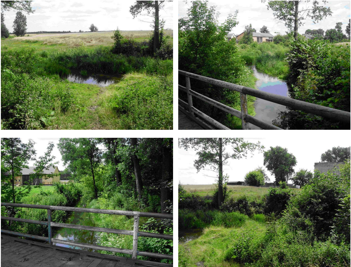
Ryc. 3 Rzeki Skrwa przepływająca przez wieś Ruda.

Rypienica to rzeka o długości 34,4 km, biegnie między innymi przez głęboko wciętą rynnę subglacjalną i jest najbardziej wysuniętą na wschód rzeką Pojezierza Dobrzyńskiego. Powierzchnia jej dorzecza wynosi 340 km 2 , z czego tylko 3,5% zajmują lasy. Reszta dorzecza składa się głównie z gruntów ornych. Swój początek rzeka bierze w granicach wsi Skudzawy w powiecie rypińskim. W jej górnym biegu zlokalizowane są liczne młyny i małe elektrownie wodne. Rypienica zasilana jest mniejszymi dopływami ale w szczególności wodami podziemnymi.