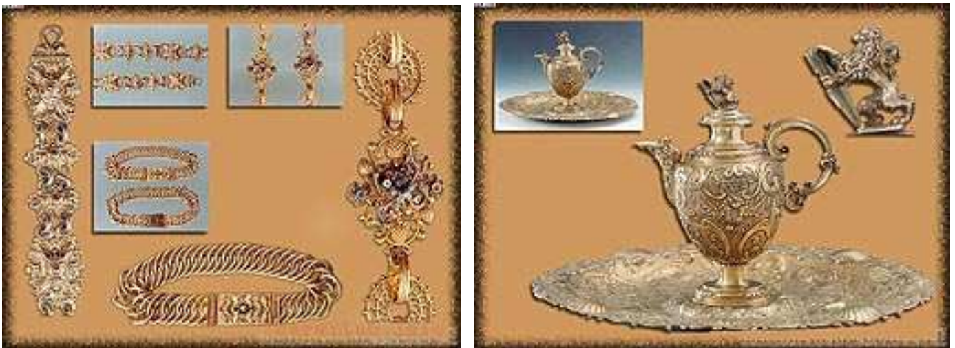
Ryc. 4. Skarb Skrwileński eksponowany w Muzeum Okręgowym w Toruniu

w 1660 roku zakończył wojnę polsko-szwedzką. W okresie konfliktów wojennych XVII wieku i towarzyszących im epidemiom i klęskom głodowym, ludność Rzeczypospolitej zmalała prawie o połowę. Podobnie było w parafii skrwileńskiej. Z czasów potopu szwedzkiego do naszych czasów przetrwał skarb odkryty w 1961 roku na grodzisku wczesnośredniowiecznym w Skrwilnie. W skład skarbu wchodziły między innymi biżuteria męska i damska (ryc. 4), zrobione ze złota i srebra zdobione kamieniami: diamentami, rubinami, szmaragdami, szafirami i turkusami oraz 51 perłami. Oprócz biżuterii znaleziono także dzban, misę, nożyce do obcinania knotów świecy, łyżeczki oraz kufle. Wszystkie przedmioty były misternie przyozdobione w liczne i skomplikowane wzory. Wyroby ze złota ważyły 2 kg, a przedmioty ze srebra około 5 kg. Właścicielem znaleziska okazała się Zofia Magdalena Piwo - ówczesna właścicielka Okalewa, która zapewne zakopła swój majątek w obawie przed skonfiskowaniem go przez Szwedów. Skarb skrwileński w chwili obecnej eksponowany jest w Muzeum Okręgowym w Toruniu.